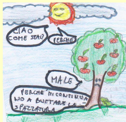
Immagine illustrata da Bonaddio L. Sozzoni C. Ferracini N.

In estate cascate che scendono dalle montagne, e in autunno tante castagne, in inverno scende tanta neve, in primavera la rondine fa sosta e beve,