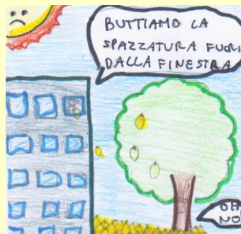
Immagine illustrata da Bonaddio L., Ferracini N., Sozzoni C.

Il riscaldamento globale sta determinando i cambiamenti climatici : l'innalzamento dei mari, ondate di calore e periodi di siccità, alluvioni e uragani, lo scioglimento dei ghiacci. Tutti questi cambiamenti avranno un impatto su milioni (1000000) di persone, della nostra generazione ma anche della prossima. Per questo motivo ricordiamo gli antichi, impariamo a rispettare il nostro ambiente, giorno dopo giorno, per noi e per gli altri, perché è facile distruggere ciò che abbiamo, ma è molto più difficile ricostruire.