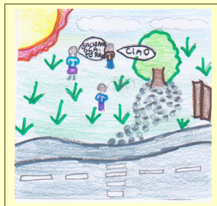
Immagine illustrata da Bonaddio L. Sozzoni C. Ferracini N.